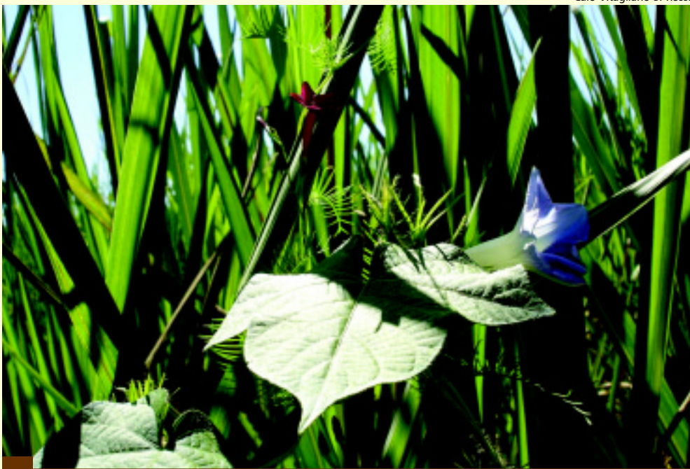
No sistema de cana-crua as infestações com plantas daninhas começam a surgir 30 a 50 dias após a colheita

Desta forma, os resultados esperados pelo controle químico de plantas daninhas é a obtenção de máxima eficácia de controle e seletividade para cultura, evitando-se as perdas por matointerferência, além de favorecer a redução do banco de sementes e facilitar a colheita mecanizada, de forma econômica e com o mínimo de efeitos ambientais (Christoffoleti et al. , 2005). Para isso, o conhecimento do PCPI, considerando as características das regiões produtoras de cana-de-açúcar do país e da escolha adequada dos herbicidas, é de fundamental importância na organização das melhores estratégias de controle de cordas-de-viola,